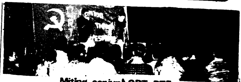
Miting conjunt ORT-PTE

SABADELL El dia 1 es celebrà una assemblea de 2.000 obrers al barri de Can Oriach, i posteriorment una manifestació de 1.000 persones amb pancartes i una bandera catalana.